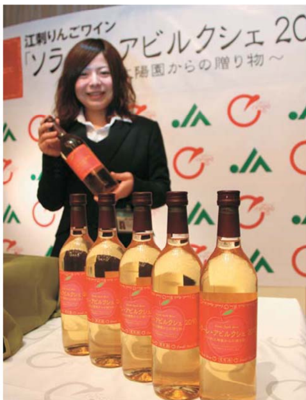
▲新発売した江刺りんごワイン「ソラーレ・アビルクシェ2010」